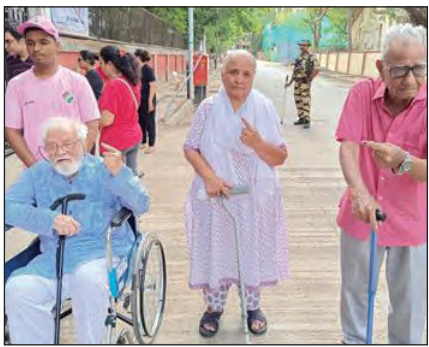
लोकसभा चुनाव के पांचवें चरण के मतदान में बुजुर्गों ने अपने मताधिकार का प्रयोग किया।